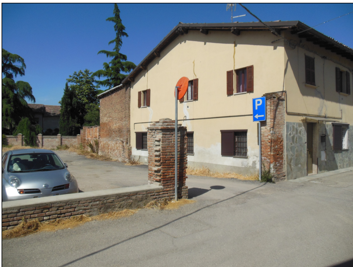
Figura 28 Area dismessa: stato attuale. Vista da via Umberto I