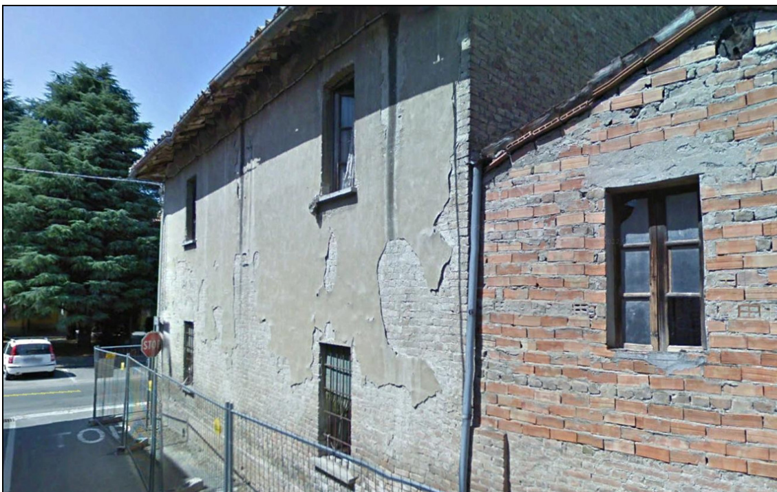
Figura 16 Area dismessa: stato precedente alla demolizione (2009). Via Cavour, edifici 4 e 5