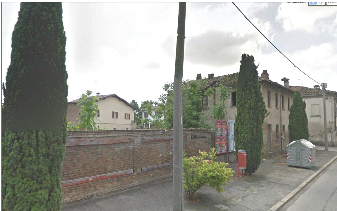
Figura 17 Area dismessa: stato precedente alla demolizione (2009). Via Umberto I, edifici 2, 3 e 4