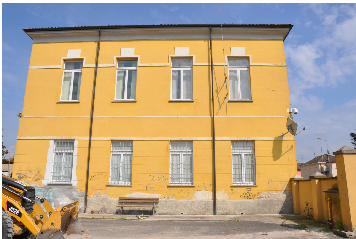
Figura 7 Il Municipio: facciata ovest