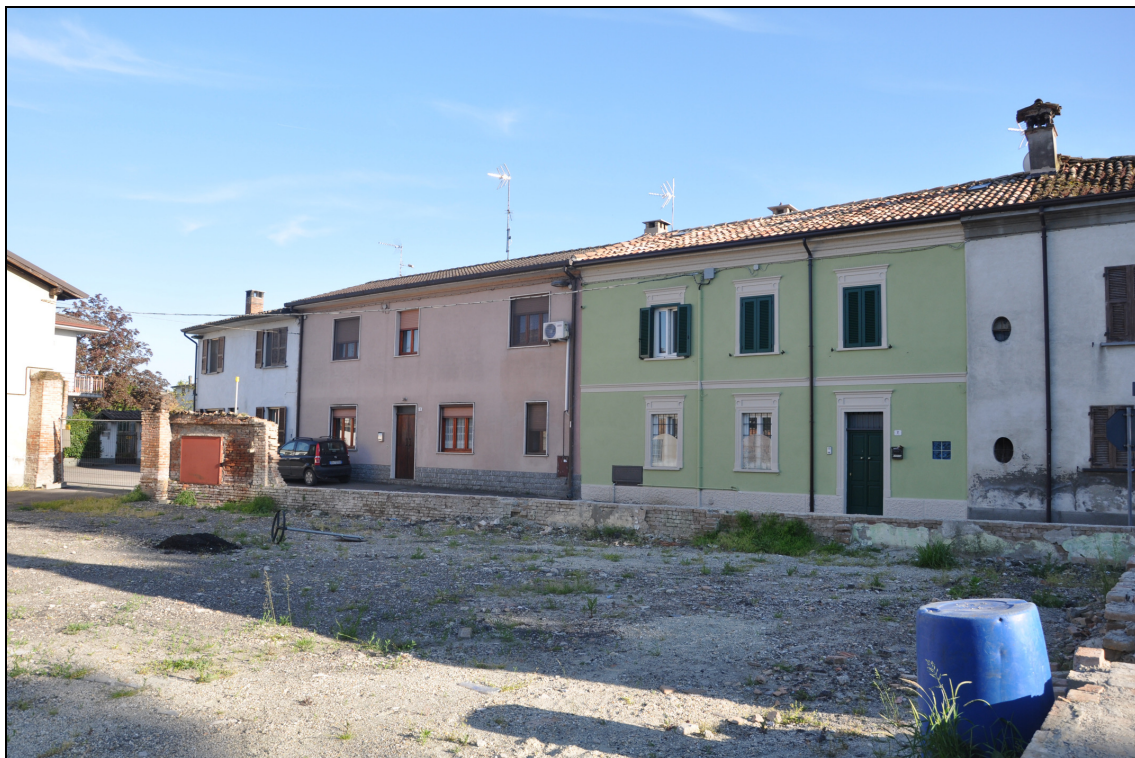
Figura 29 Area dismessa: stato attuale. Vista da via Umberto I