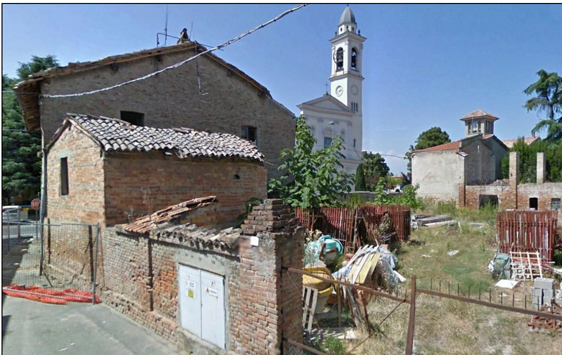
Figura 15 Area dismessa: stato precedente alla demolizione (2009). Via Cavour, edifici 4 e 5