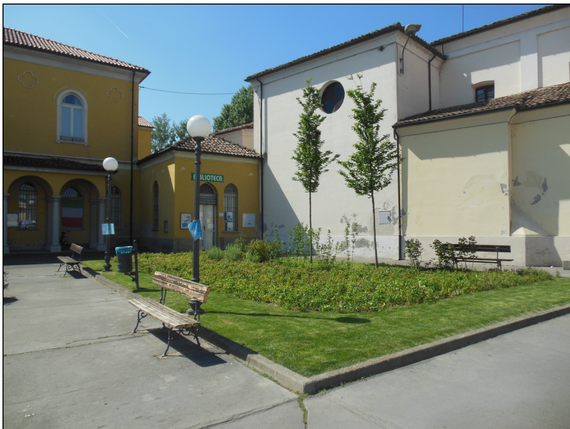
Figura 9 Piazza Capitan Albini fotografata da via Umberto I