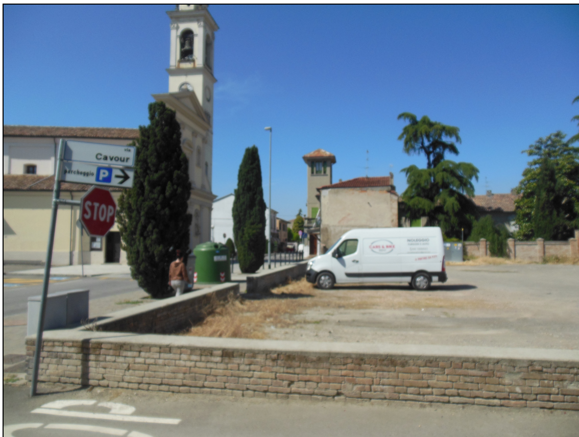
Figura 21 Area dismessa: stato attuale. Vista da via Cavour, angolo via Umberto I