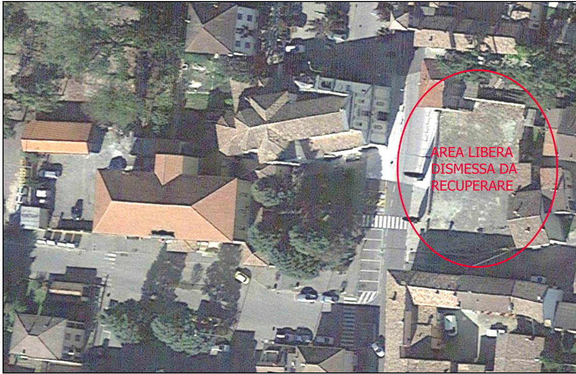
Figura 19 Area dismessa: stato attuale. Fotografia aerea

Il presente progetto prevede il recupero e la riqualificazione dell'area, che sarà in parte destinata a piazza, in parte ad area verde alberata e, in minima parte, a parcheggio, per trasferirvi alcuni posti macchina attualmente situati in piazza Capitan Albini.