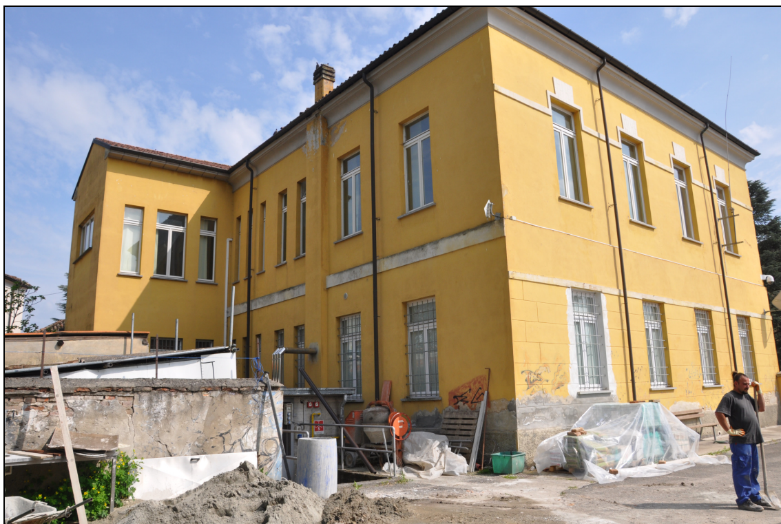
Figura 4 Il Municipio: facciate nord e ovest