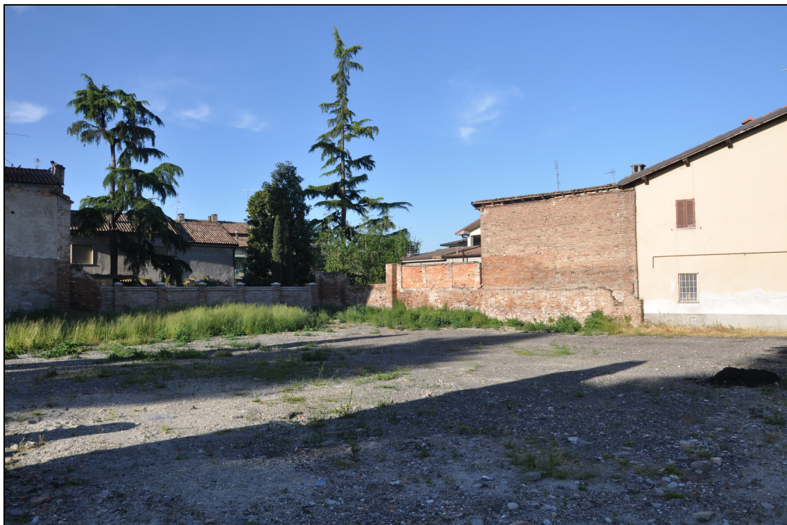
Figura 27 Area dismessa: stato attuale. Vista da via Umberto I