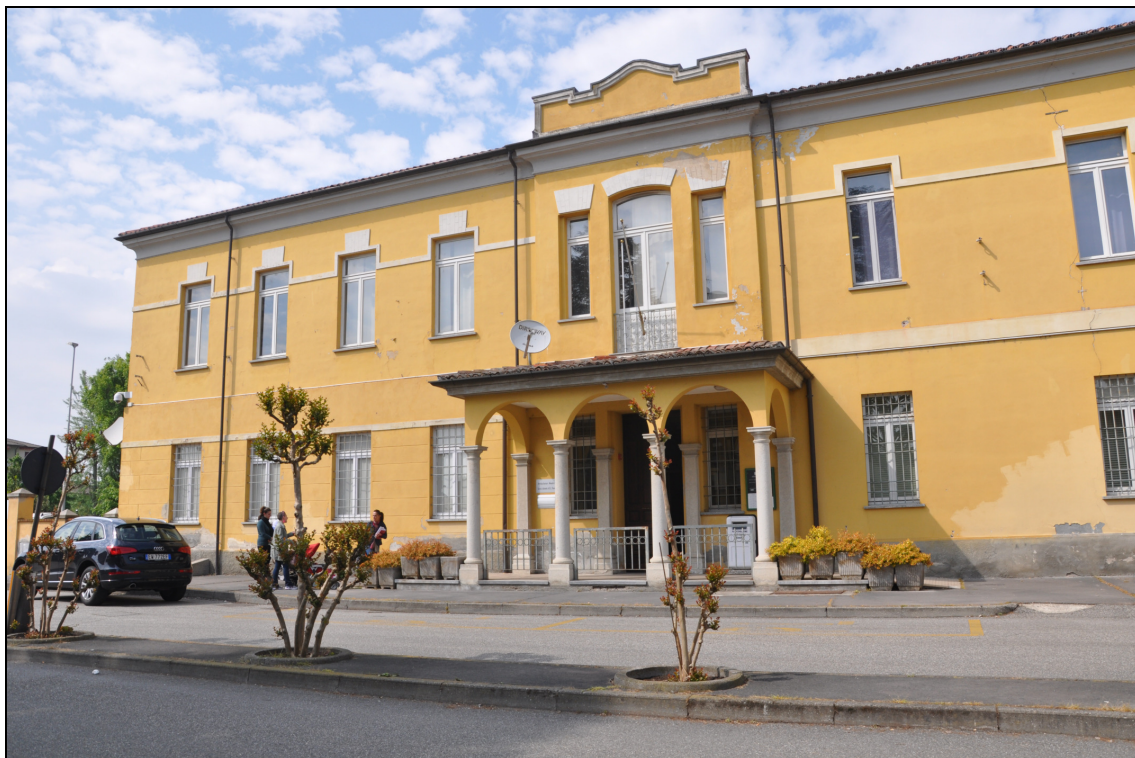
Figura 5 Il Municipio: facciata sud (via Martiri della Libertà)