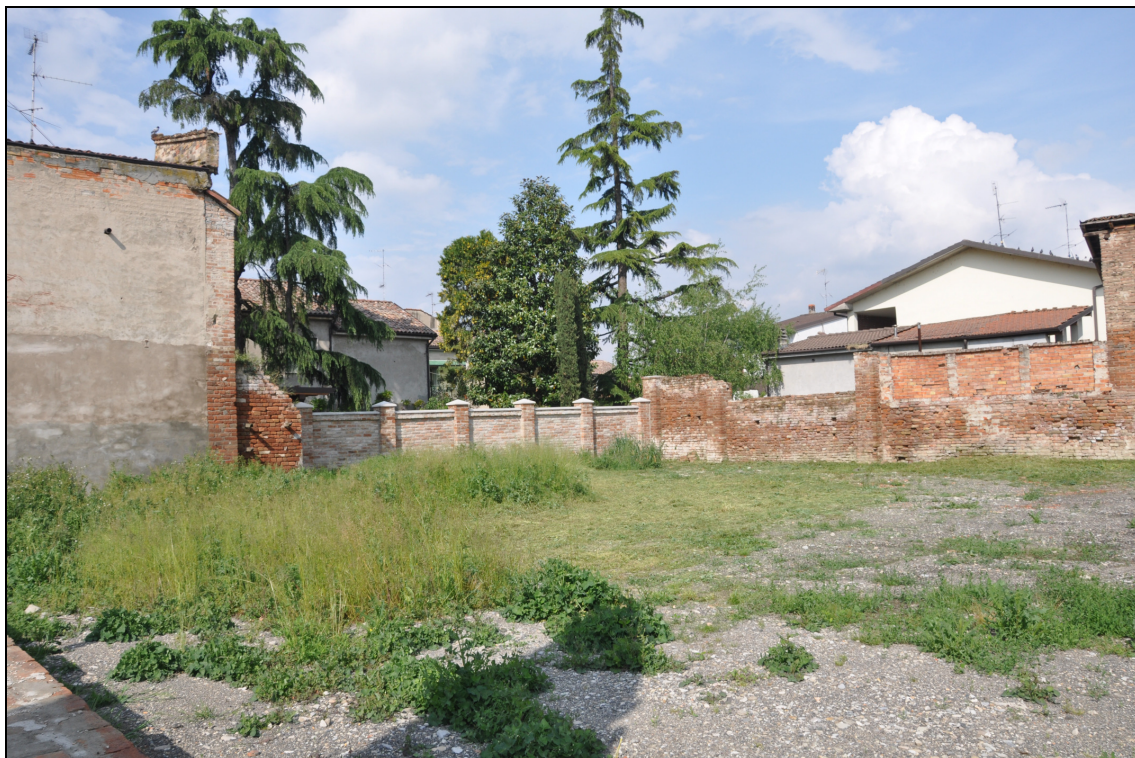
Figura 25 Area dismessa: stato attuale. Vista da via Umberto I