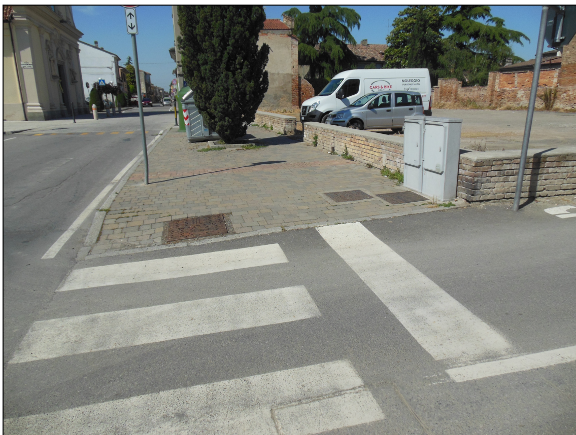
Figura 26 Area dismessa: stato attuale. Vista da via Umberto I