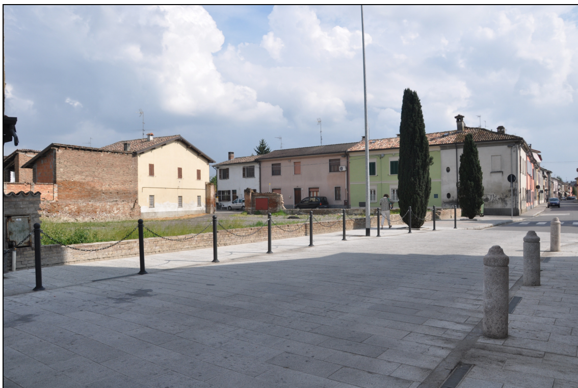
Figura 24 Area dismessa: stato attuale. Vista da via Umberto I