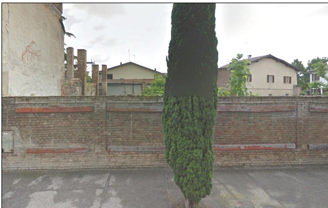
Figura 18 Area dismessa: stato precedente alla demolizione (2009). Via Umberto I, edificio 1