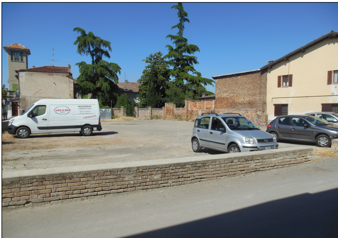
Figura 20 Area dismessa: stato attuale. Vista da via Cavour