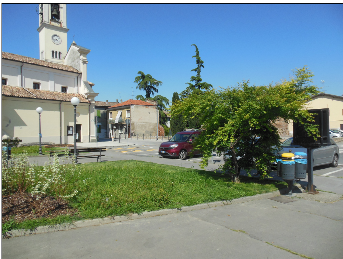
Figura 10 Piazza Capitan Albini fotografata dall'angolo con via Umberto I