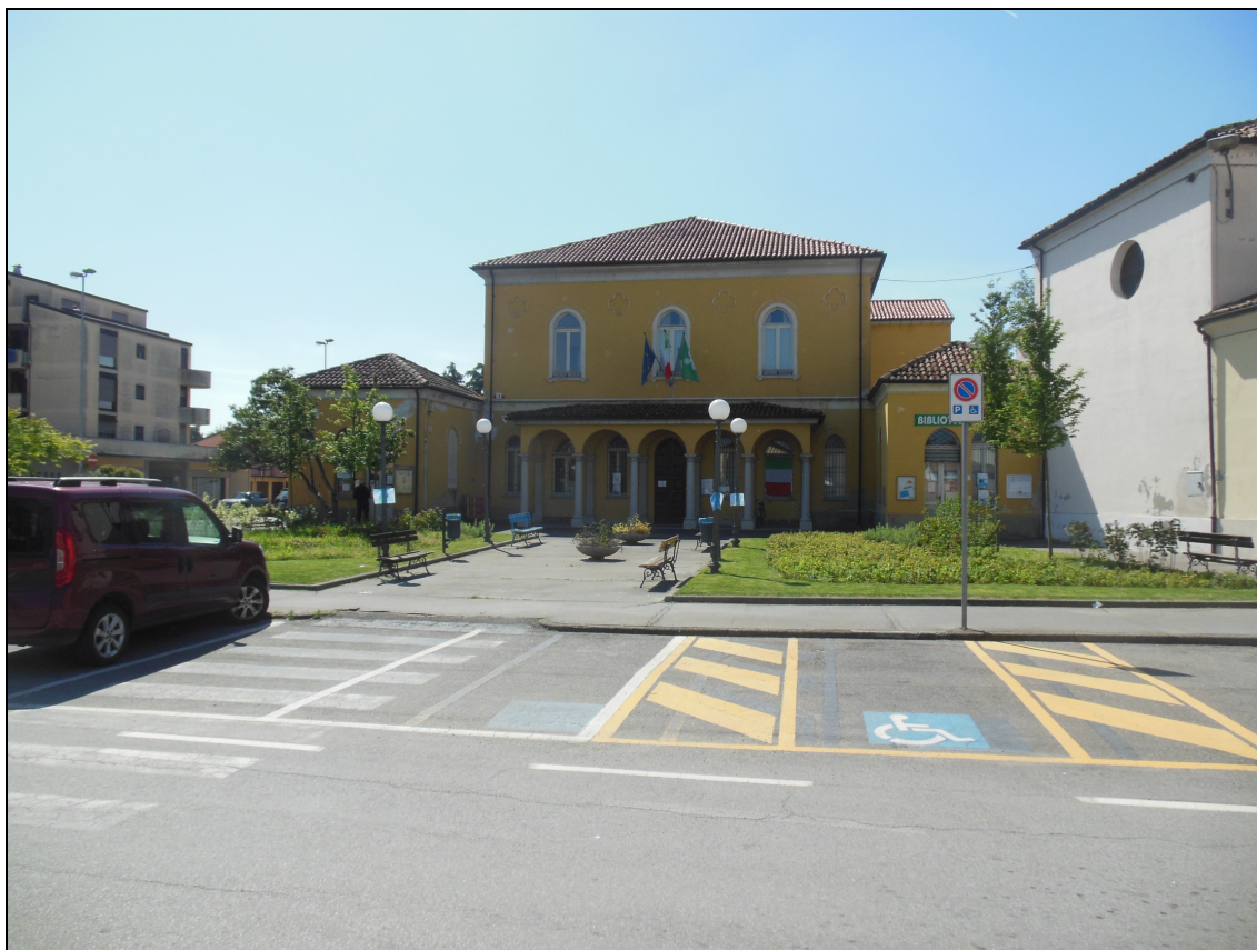
Figura 8 Piazza Capitan Albini fotografata da via Umberto I

Le fotografie della piazza, nello stato di fatto, sono riportate di seguito.