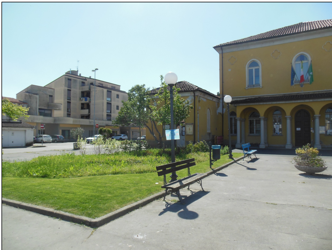
Figura 3 Il Municipio (facciate est e sud) visto da via Martiri della Libertà