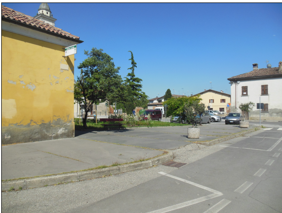
Figura 12 Piazza Capitan Albini fotografata da via Martiri della Libertà