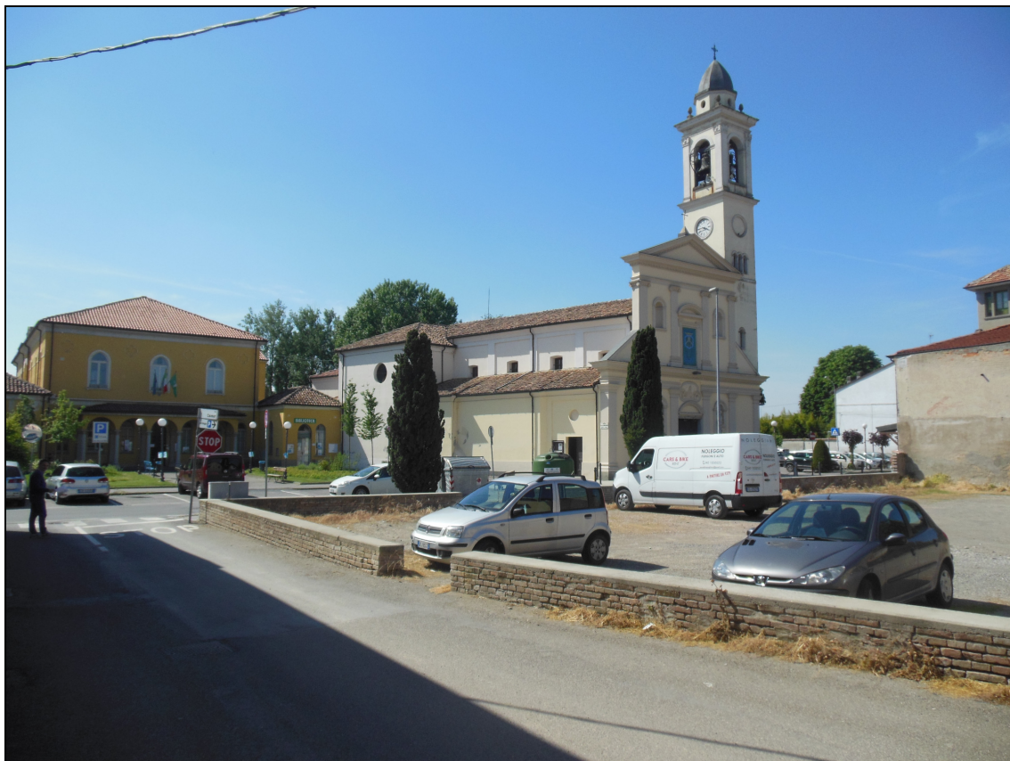
Figura 23 Area dismessa: stato attuale. Vista da via Cavour