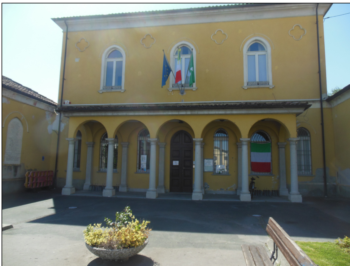
Figura 2 Il Municipio (facciata est) e la piazza Capitan Albini

Le fotografie del municipio, nello stato di fatto, sono riportate di seguito.