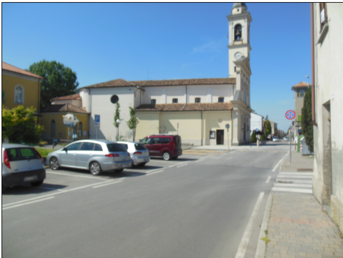
Figura 13 Piazza Capitan Albini fotografata da via Umberto I