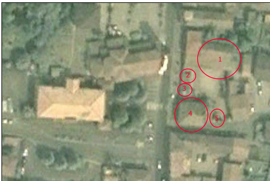
Figura 14 Area dismessa: stato precedente alla demolizione (2009). Fotografia aerea con numerazione edifici

Si può notare che detti edifici erano assolutamente privi di valore storico o architettonico, e che lo stato di conservazione in cui si trovavano li rendeva pericolosi per la pubblica incolumità.