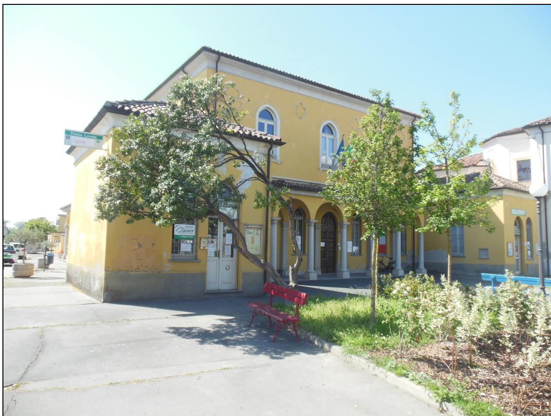
Figura 11 Piazza Capitan Albini fotografata da via Martiri della Libertà